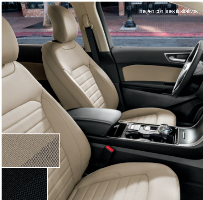
Imagen con fines ilustrativos.