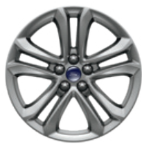
18" DE ALUMINIO PINTADO COLOR SPARKLE SILVER CON BRAZOS DIVIDIDOS Estándar