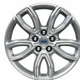
DE 18" DE ALUMINIO PINTADO Estándar