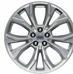
DE 20" DE ALUMINIO PINTADO PREMIUM Estándar

Cuero Ebony con Inserciones Perforadas /1-9